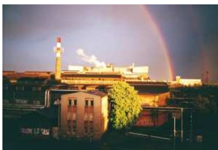
Pohled z mého okna. Komín a duha.

Už loni jsem tvořil něco podobného, ale pak jsem hledal odvahu to rozesílat. Bylo z toho osm čísel a přemýšlení, zda si nevytvořit vlastní blog. Ten jsem zamítl z důvodů možných negativních reakcí, pro mne, absolutně cizích lidí. Přece jen větší radostí je psát pro známé, naladěné skoro na stejně vlně. Nápady, které by prospěly tomuto pláčků zrovna moc neoplývám. Když jsem bydlel v centru Ostravy, psací stůl u okna, tak to se nápady plýtvalo. Pod okny byl život. Bylo se na co dívat. Ženské, tramvaje, ženské, auta, ženské atd. atd. Pořád se něco dělo. Teď do mého okna vlezte romantika a krása minimálně. Jednou přišla duha. Když odešla zbyly zase jen ocelárny Vítkovice. Vítkovice Steel. Duha zmizela, komín zůstal. Můj první text v tomto bytě, při pohledu z okna, začínal: „Tovární komín, penis černého města“ atd.. Takže kdyby někoho z Vás napadlo do mého Nočníčku něčím přispět, a nemusí to být jen o mě, jste vítáni. Platím však jen úsměvem a milým pohledem.