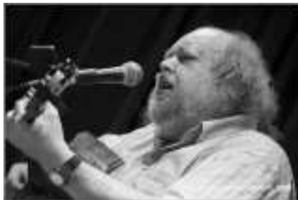
Duben: Mělník