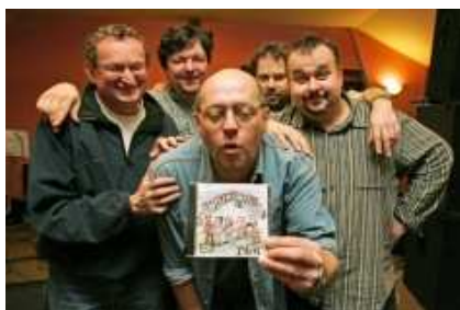
BLAF – CD Jadymy dali

vědí, co chtějí. Tuším, že do dnešního dne vydali už pět CD, z nichž poslední (Jadymy dali) vyšlo přednedávnem. Asi ze stovky jejich písní jsem pro sebe objevil tu NEJ - píseň Brisbane z alba „Tu stela“ (Tady vodcad') přímo miluji. Schválně si poslechněte na www.blaf.cz . Blaf má snad jedinou smůlu. Zpívá v goralském nářečí. Vždyť jsou od Jablunkova, z Hrádku ve Slezsku. A západně od Moravy ubývá těch, kteří jim rozumí.