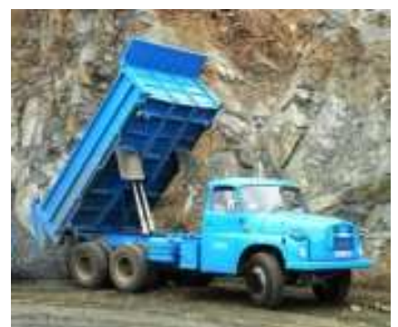
Obrázek nahoře: Tatra 138