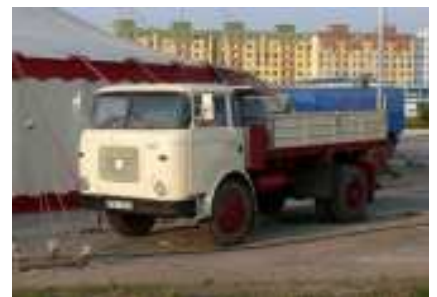
Obrázek nahoře: Škoda 706