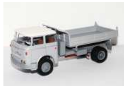
Obrázek nahoře: Škoda 706RT