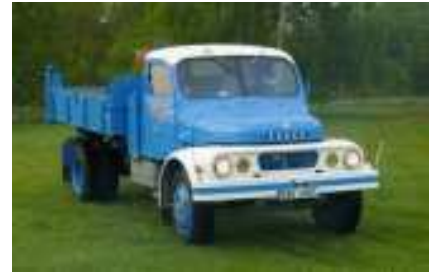
Obrázek nahoře: Praga S5T

na Tatre 111, Škodu 706, Škodu 706 RT takzvaný „trambus“ a Tatre 138.