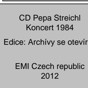
CD Pepa Streichl Koncert 1984 Edice: Archívy se otevírají EMI Czech republic 2012