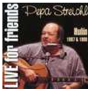
CD Live for friends 150,- Kč