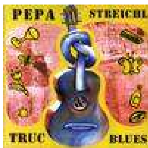
CD Pepa Streichl & Truc blues 150,- Kč