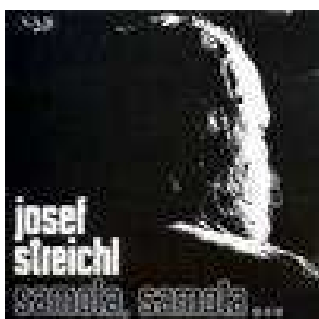
CD Samota, samota... 150,- Kč