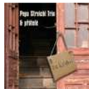
CD Za dveřmi 150,- Kč