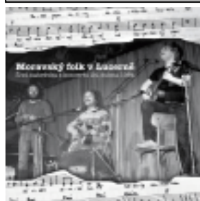
CD Blues Bazaar 150,- Kč